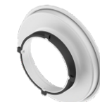
Adaptador G3 / 135mm

acompanha os seguintes modelos: STRIP SPOT 20x90 G4 STRIP SPOT 30x140 G4