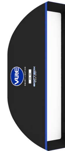
SOFTBOX STRIP SPOT