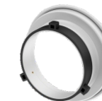
Adaptador G4 / 135mm

acompanha os seguintes modelos: STRIP SPOT 20x90 G4 STRIP SPOT 30x140 G4