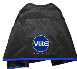
Rebatedor Preto/Prata Obs.: Fixado junto ao Difusor externo