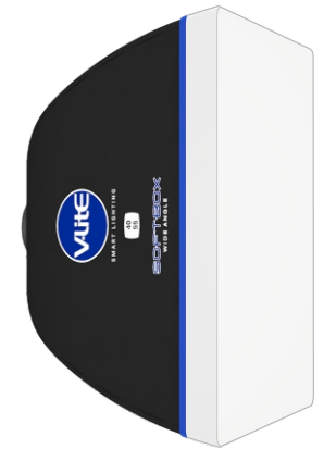
SOFTBOX WIDE ANGLE