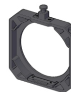
Anel para Softbox